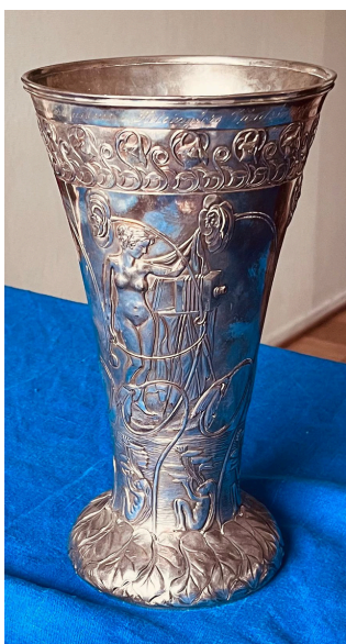
Vandringspokalen Qvinnan introducerades 1956 och tävlades ut varje år, med ett oförklarligt uppehåll mellan 1967 och 2005. På pokalen finns 31 vinnarnamn ingraverade.