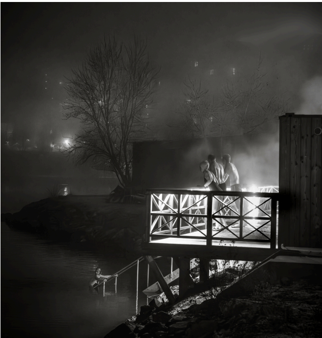
Somebody Missing (Bastu)