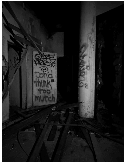
Don't think too much