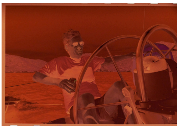
Det skannade negativet.

P.S. I de nya versionerna av CO sköts hela den här cirkusen med en knapptryckning, men systemet i min sju år gamla dator är inte kompatibelt. Därför fortfarande lite "gör-det-själv".