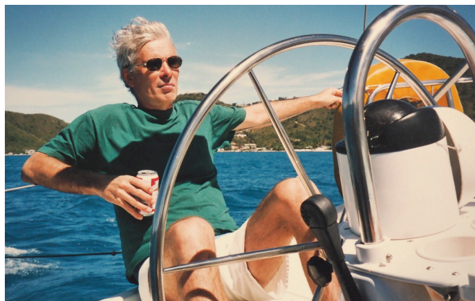
Slutliga resultatet efter justering.

Jag hade nu några vrålorange negativ i datorn att jobba vidare med. Använder mitt gamla men mångsidiga bildbehandlingsprogram, Capture One. Utgår från att läsare med till exempel Photoshop kan göra ungefär samma sak.