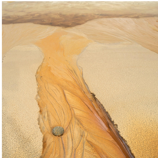
Minimalism-2 Placerade andra plats i månadstävlingen.