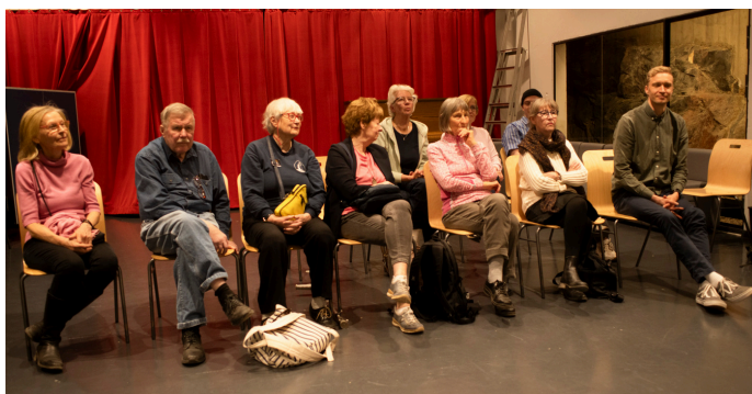
Månadsmötet hålls som vanligt på Sandels ungdomsgård.