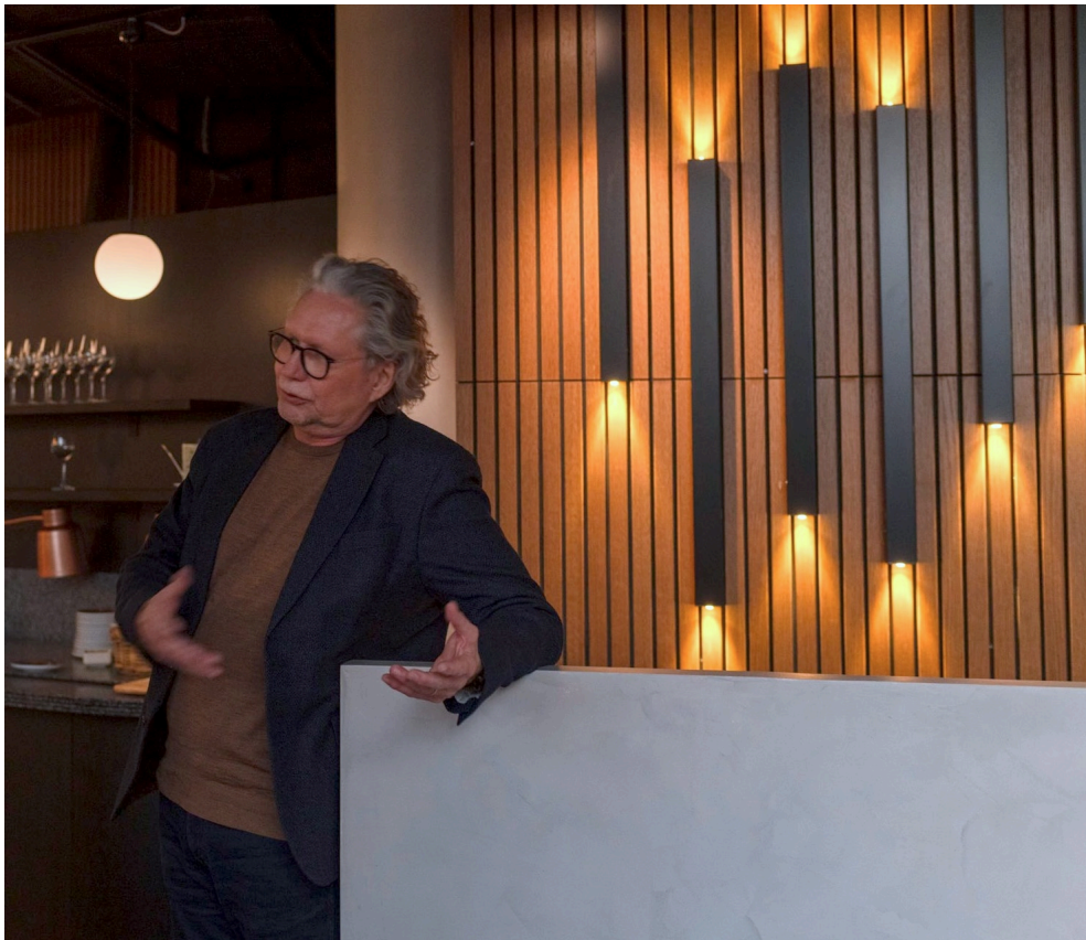
Klubbens 136 år firades på restaurang Dagmar 06.03. Vi var 12 inklusive en gäst från Yrkeshögskolan Novia, Bildkonstnär Lars Rebers.