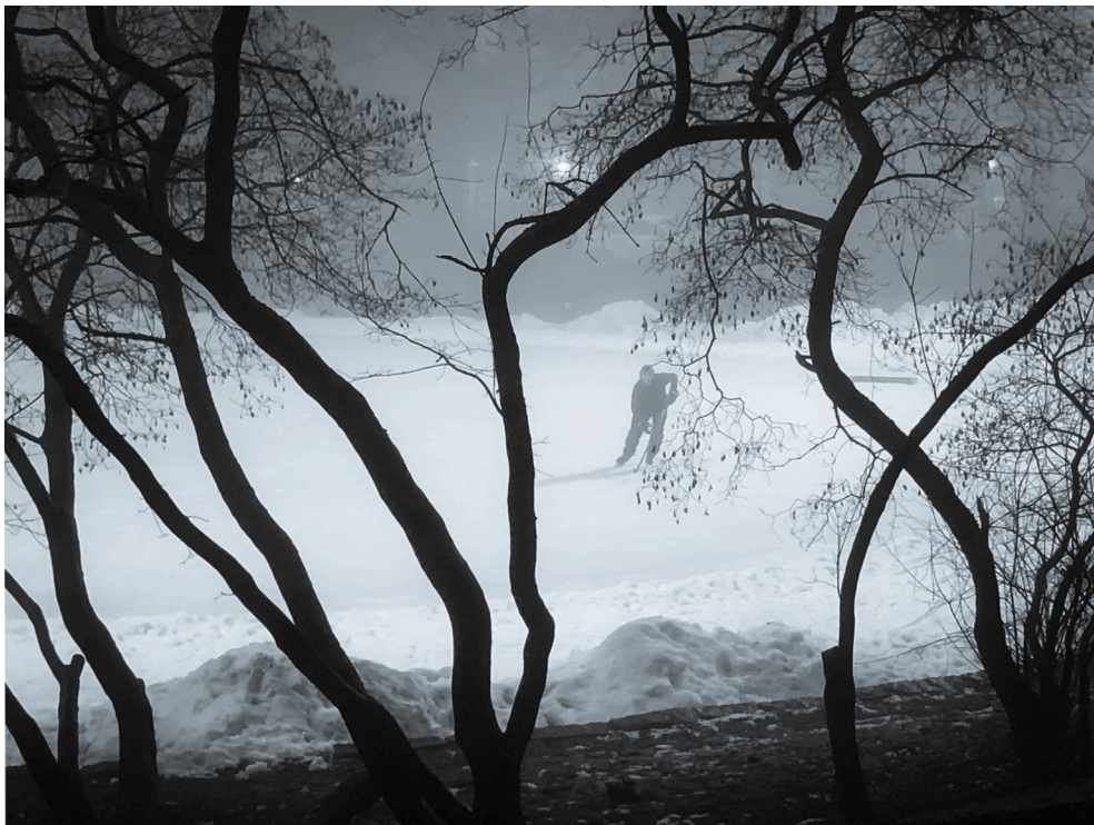
På vägen till månadsmötet i dimman, telefonbild.