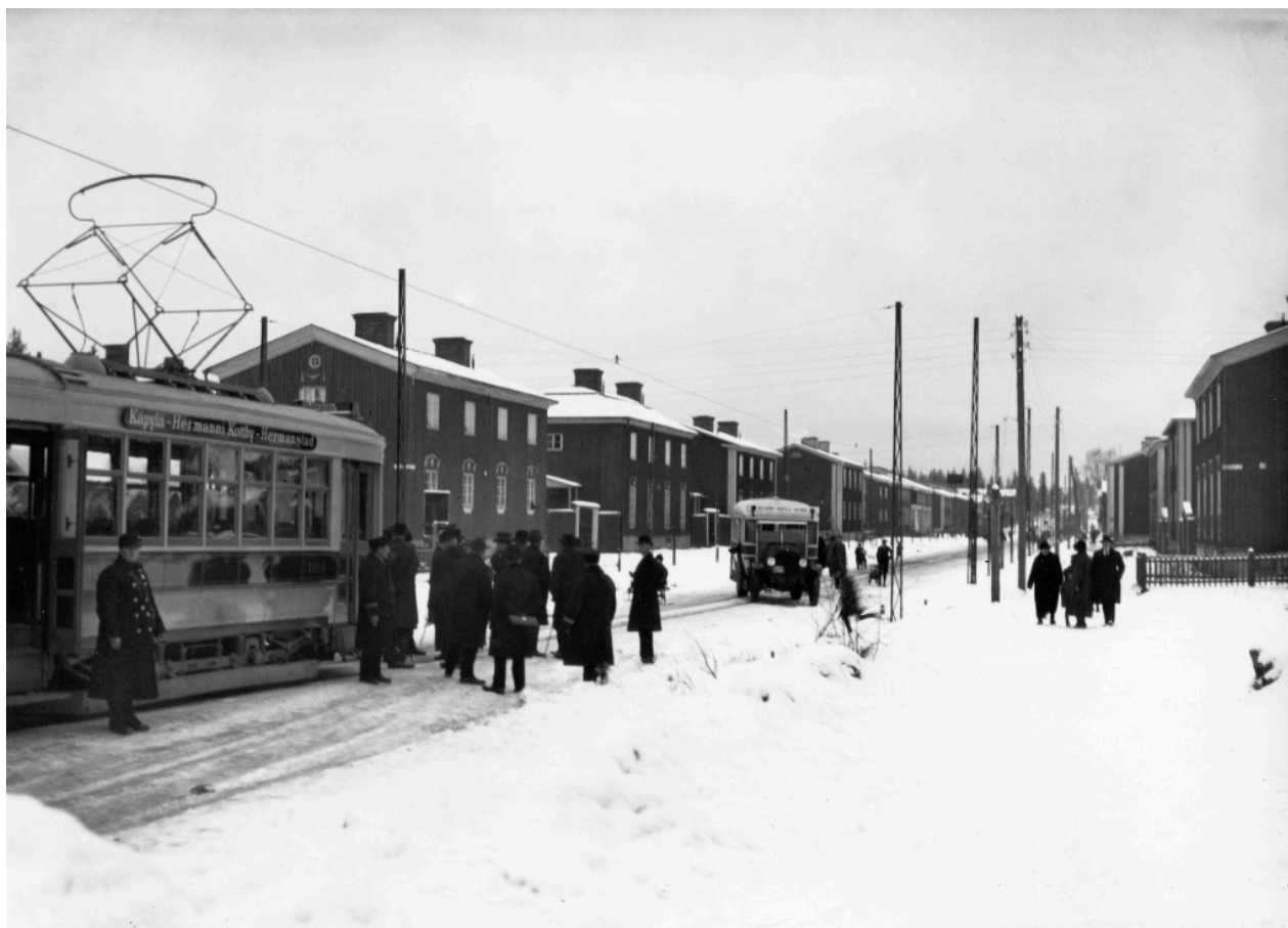
Kottby, Pohjolagatan, 1925

Spårvagnstrafiken öppnades till Kottby förorter, den första spårvagnen på Pohjolagatan och Kottby-bussen.