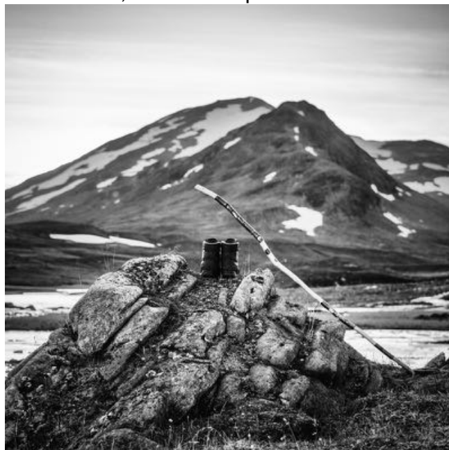
Någonstans i Sarek...

Sedan skulle det ha varit dags för traditionstävlingen. Tyvärr fanns det dock inte tillräckligt många tävlingsbidrag att det skulle ha räckt till en tävling. AFK har ju under alla år försökt hålla uppe intresset för traditionella fototekniker, genom att tillhanda mörkrum och anordna kurser med mera. Med tanke på klubbens historia skulle det nog vara viktigt att hålla igång hantverket också inom klubben och inte bara genom kurserna i Arbis regi. Men det krävs förstås ett genuint intresse för "handarbetet" i mörkrummet. Något för styrelsen, eller egentligen alla medlemmar, att fundera på!