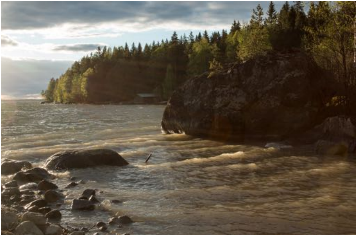
Vårutfärdsutsikt vid Roine.

Harith Raad Salih hälsas hjärtligt välkommen som ny medlem i klubben!