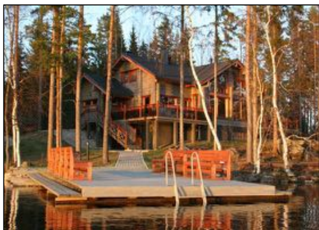
Så här ser Villa Elegante ut på utsidan.