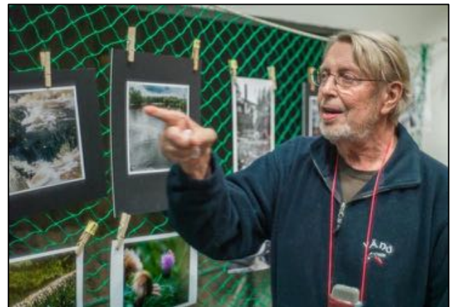
Den motvillige domaren

sa han. "Det andra är att jag är en ohjälplig romantiker. De sakliga bilderna försvinner nog nästan. Dessutom älskar jag bilder, har alltid gjort det. Så på det sättet är det bra. Felet är att någon måste vinna."