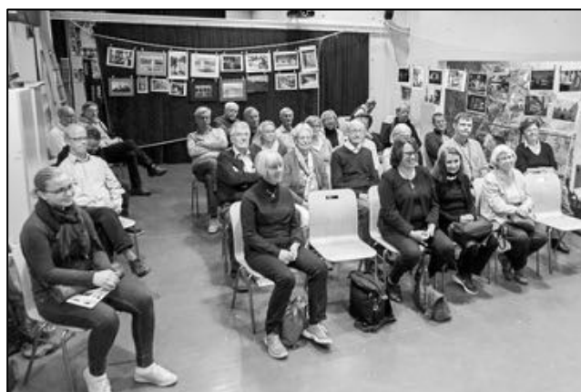
Den uppmärksamma mötespubliken.

“Den här bilden tittade jag länge på. Här finns många element. Alla verkar lite trötta, även de som sitter på rad längre fram, och hundens min är så bra. Kvinnans mönster i tröjan går igen i mannens tatueringar. En minimal beskärning från båda sidor skulle koncentrera bilden ännu mer.”