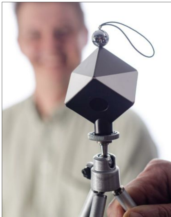
Detta är Luddes hemliga vapen: Spydercuben.