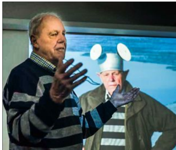
Caj Bremers föredrag var som vanligt både intressant och roligt.