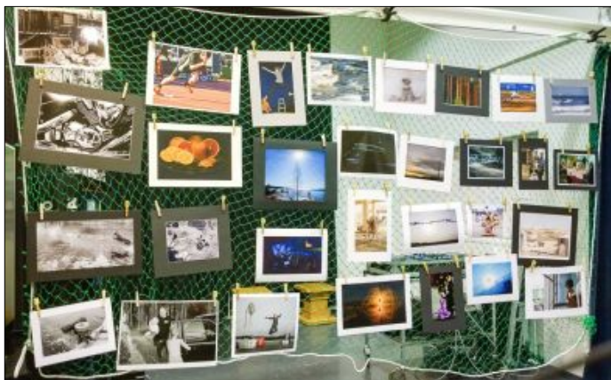
"Energibilderna" på tävlingsnätet i februari var många, lite färre var bilderna i temat Kvinna i tiden.

Vill du vara med i AFK:s bokcirkel? Vill du låna och läsa en intressant fotobok per månad? Ta i så fall med dig en eller flera av dina böcker och kom till bildcirkeln torsdagen den 19.3. kl. 18:00!