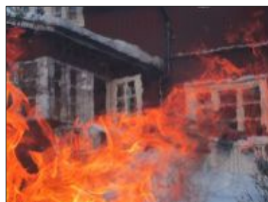
(bilden på första sidan)

"Den här väcker så mycket tankar: är det huset som brinner eller är det, som jag antar, så att bilden är tagen genom en eld mellan huset och fotografen. Man kan känna hettan och hur luften vibrerar. Den är tagen på vintern, vilket ger kontrast mellan varmt och kallt, och det gör sitt till i bilden."