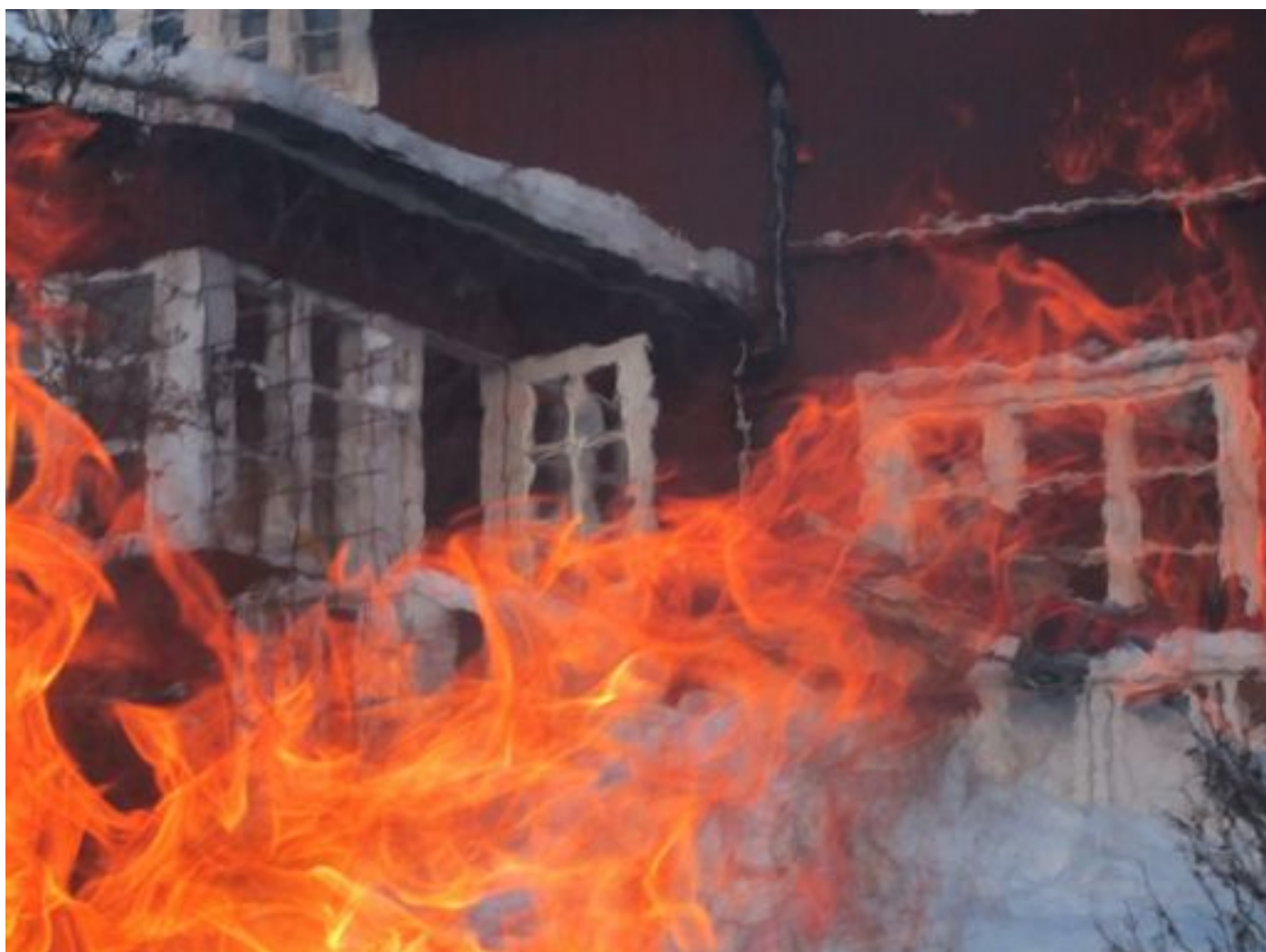
Lucille Rosenqvists " Eldigt " tyckte domaren väckte många tankar, och den fick en tredjeplacering i Månadens bild med temat "Eld".