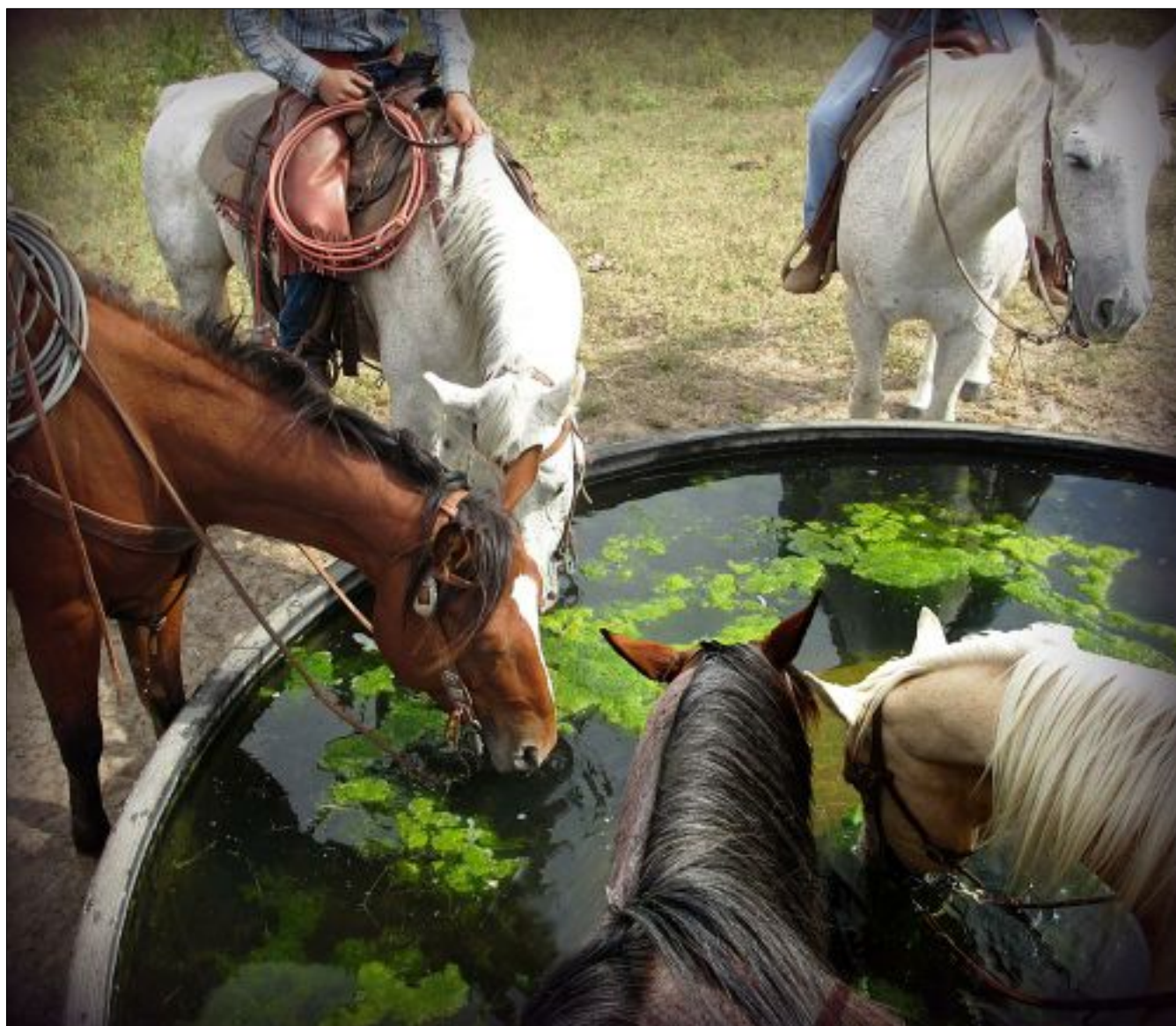
"Efter en lång ritt" heter denna bild av Lea Laine, som fick ett hedersnämmande i färgserien i Månadens bild: Törst.