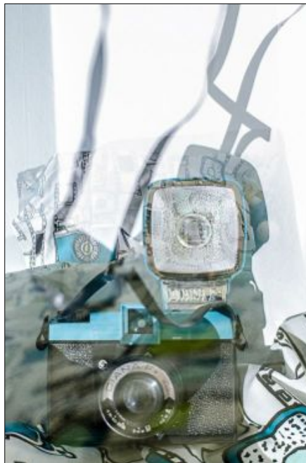
turkos plastik/med glappande sömmar skapar estetik/och söta drömmar bongade dianan på örngott som jag av vännen fått (dubbelexponering)