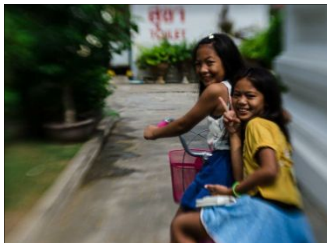
De här tjejerna cyklade förbi ett buddhisttempel i Thailand. Jag avverkade tio tempel på en dag med ett gäng troende thailändare (objektiv: lensbaby)

Tänk vad ett foto om dagen kan ge, prova själv så får du se!