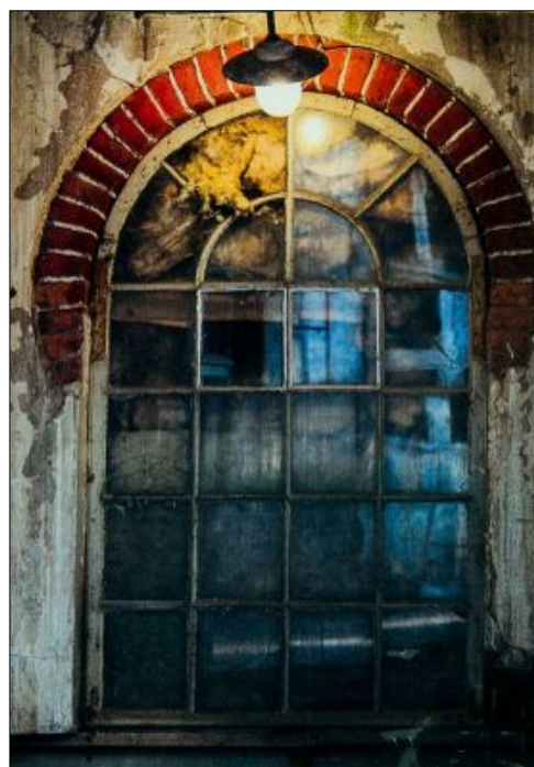
Inbjudningskortet till vernissagen av Mariefors Blues