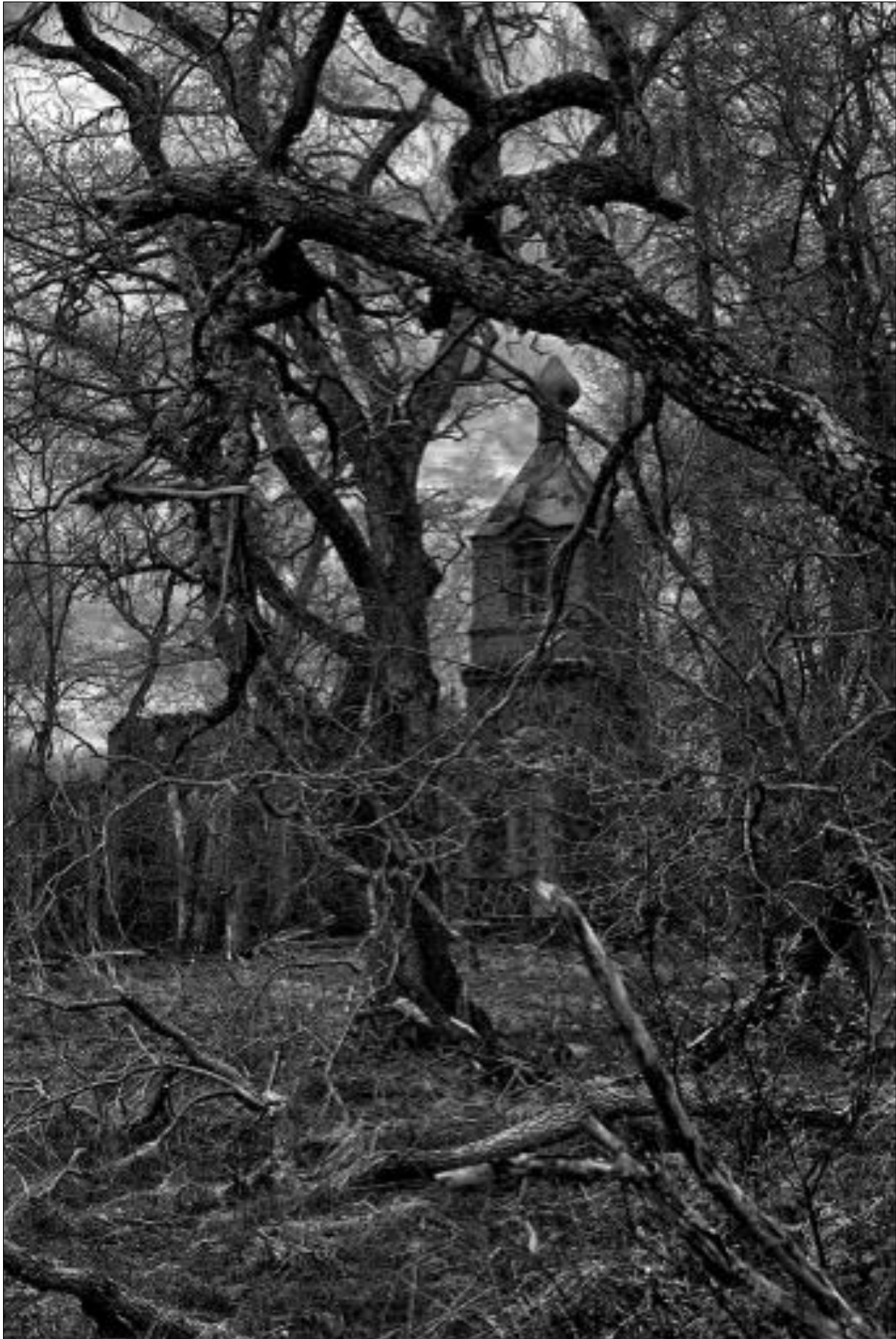
Kristian Frantz: Church ruin

"Den här bilden snärjde mig helt och hållet i sina grenar. En kuslig kyrka bakom ett grenvirkvarr. Fotografen har lyckats perfekt med stämningen. Den skulle kunna vara illustrationen till en skräckfilm, till det är den tillräckligt surrealistisk."