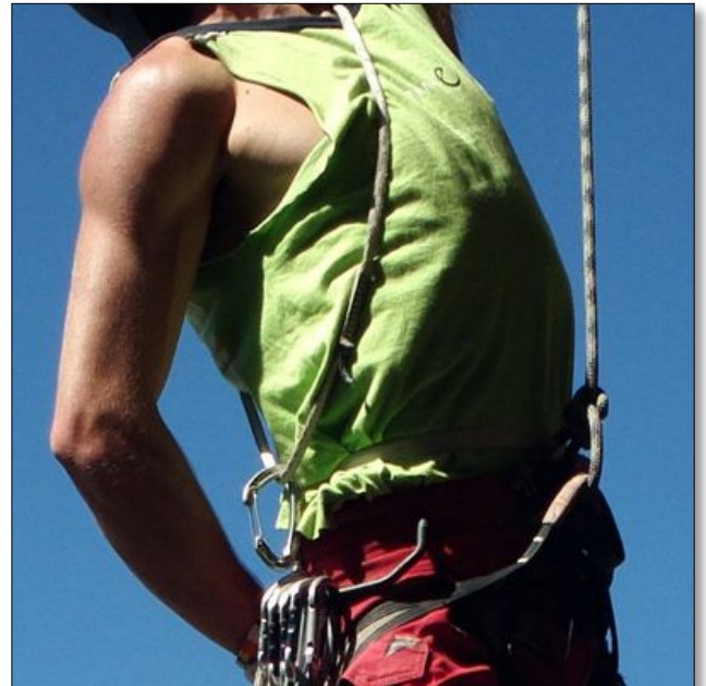
Full bild och beskuren bild som visar att man kan urskilja håren på mannens överarmar samt trådarna i repet, med hjälp av den nya Nokians 41 megapixelar.