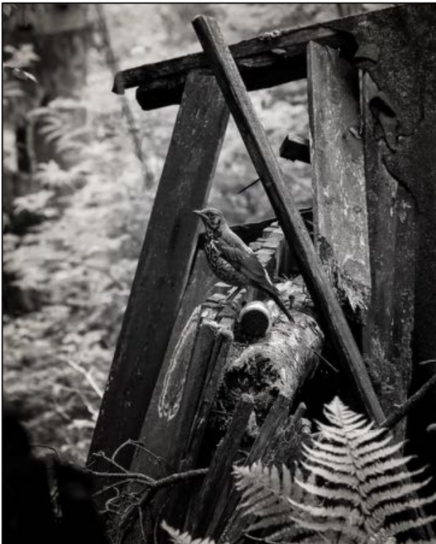
I Ghita Thomé: Ensam kvar

"Den här bilden med fågeln blev jag förtjust i genast jag kom in här. Känslig, bra komposition. Man ser tillräckligt av omgivningen för att veta var man befinner sig - någonstans i skogen vid en förfallen byggnad, men så finns där liv också. Allt är på plats."