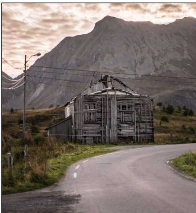
II Anders Blomqvist: Ödehus, Fredvang

“ Det här är något vardagligt, finländskt. Det är bra att fotografen gått över till baksidan, och sett med andra ögon på motivet. Det här är liksom ingenting märkligt, men stämningen är rätt.”