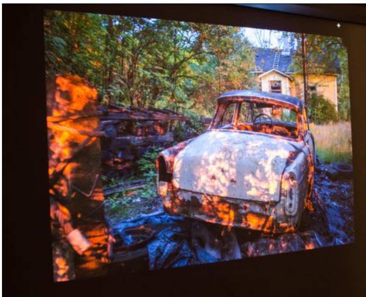
En av Sami Perttiläs ljusmålade, färggranna bilar med ett ödehus i bakgrunden.