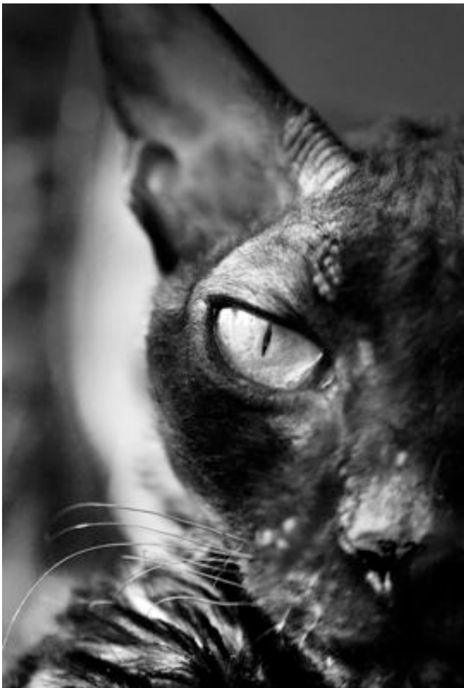
Urda Fogel-Michaels Cappuccino Carbonara, svartvit etta.