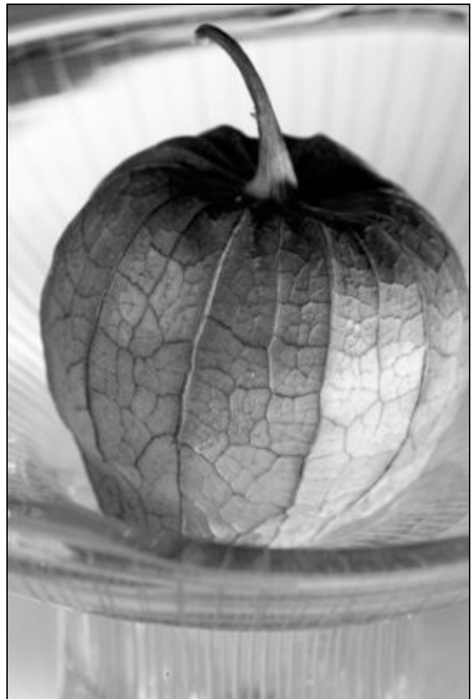
Peter Stenius Tomato, svartvit trea.